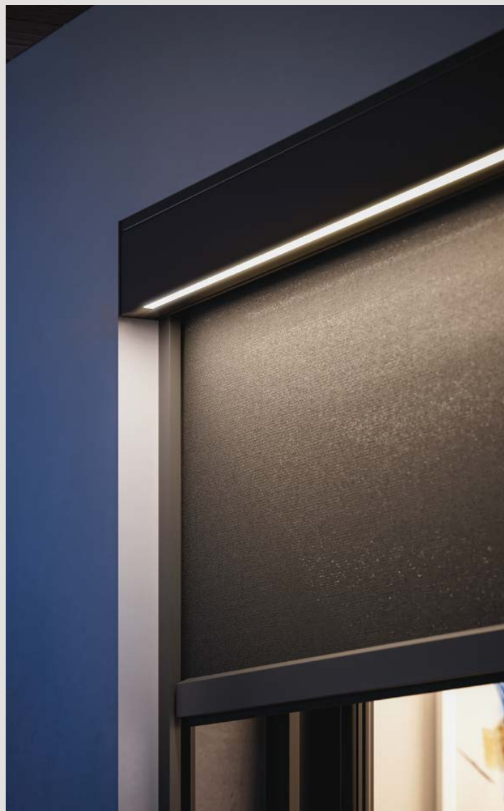
DIMMABLE LED LINE

ES El toldo vertical T-Zone es la solución ideal para la protección solar: alcanza los 15 metros cuadrados de ancho, garantizando siempre resistencia y estabilidad, gracias al deslizamiento con cremalleras laterales de resorte. Cuando se enrolla, la lona desaparece en una estructura de aluminio de diseño elegante y personalizable con LEDs regulables, para disfrutar al aire libre incluso por la noche.